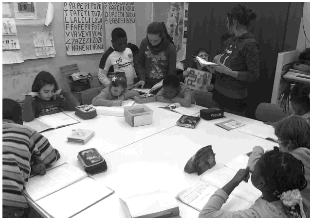
Il doposcuola è promosso dall'Associazione Famiglie di Santo Stefano negli ambienti dell'Oratorio "G. Maffei" della parrocchia di Santo Stefano

Alla voce "oratorio" del sito internet parrocchiale, si trova la voce doposcuola. Si apre una pagina che con scarse note e qualche fotografia consente di ripercorrere, tuttavia, una storia nata per scommessa alcuni fa. Era il 2002 quando alcuni genitori sistemano due stanze,